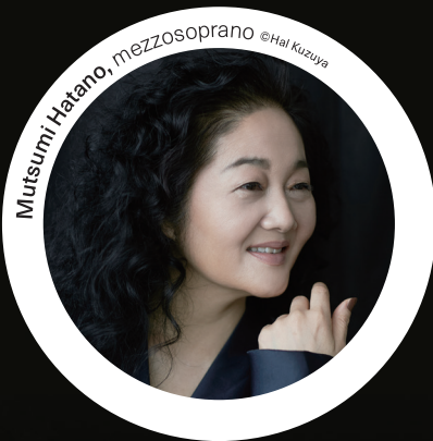
Mutsumi Hatano, mezzo-soprano