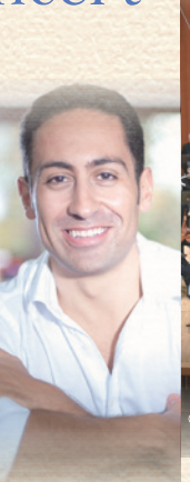
指揮 ナビル・シェハタ (2014年受賞) Nabil Shehata, Conductor