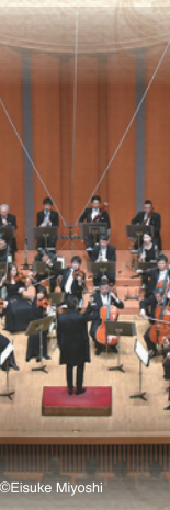
管弦楽 紀尾井 シンフォニエッタ Kioi Sinfonietta