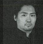
崎谷直人 | Naoto Sakiya, violin