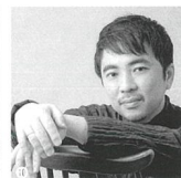
桐朋学園オーケストラ Toho Gakuen Orchestra