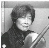
① 今井信子 (ヴィオラ) Nobuko Imai, viola